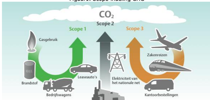
Figuur1: Scope-indeling GHG

Het Green House Gas Protocol maakt onderscheid in verschillende scopes op basis van de herkomst van het broeikasgas.